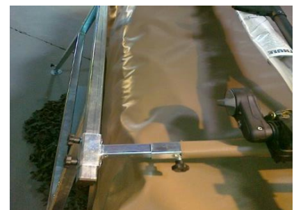
Naar buiten schuiven van de beugel.