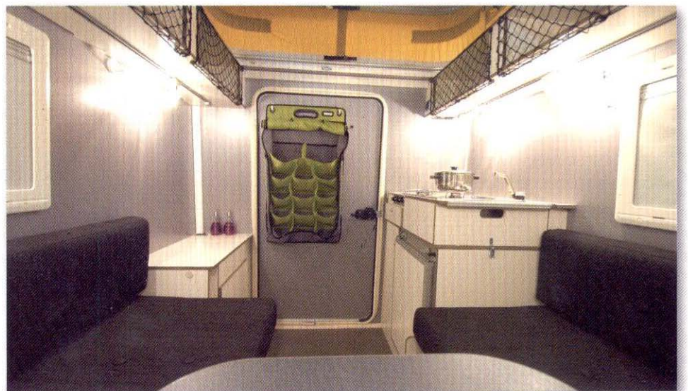
Zicht naar achter

de praktische uitvoering. Dit maakt dat men gerust over hobbelige wegen kan rijden zonder dat er van alles los begint te rammelen. Zo zijn de deuren van de tamelijk diepe bovenkasten vervangen door een net. Links en rechts van de buitendeur zijn eenvoudige kastjes vervaardigd uit 14 mm dikke multiplex en bekleed met een