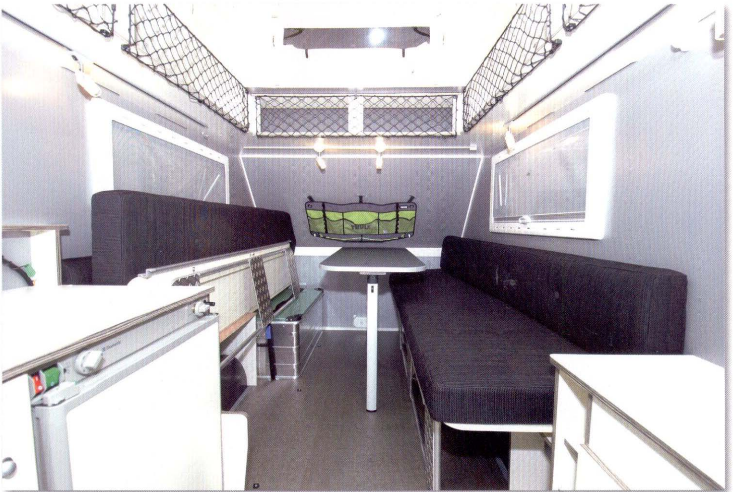
Zicht naar voor

Het zware AL-KO chassis in combinatie met de dikke banden geven geen krimp als ze meedogenloos over hobbelige wegen worden gereden.