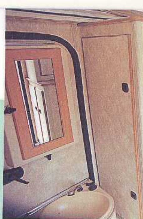
Achterin de Xplorer bevinden zich twee zit/slaapbanken. Twee bovenkastjes konden nog net worden ingepast. Langs de onderkant van de banken zijn stalen strips met sjerhaken aangebracht. Zware bagage wordt daarmee op de vloer vastgezet. Tijdens de rit hangt de badkamer (links op de foto) binnen aan de deur