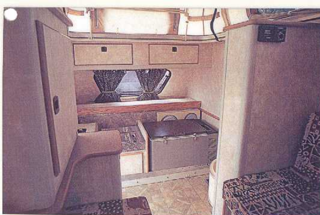
De ingeschoven keuken met rechts de compressorkoelbox. Achter de koelbox de servieshouder met standaard borden en mokken. Boven de keuken kan een tweepersoons kinderbed uitgekapt worden, de kussens lieten we buiten beeld

door steenslag, struiken, boomtakken en hongerige roofdieren te weerstaan. Het achterwandje, dat binnenin zelfs nog versterkt is met een stalen plaat, draagt dan ook zonder moeite twee 20 liter jerrycans en het zware reservewiel. De enorme wielen met terreinbanden in de niet geringe maat 245/75R15 zorgen voor veel bodemvrijheid van de as. Maar liefst zes bouten klemmen ze tegen het rubbergeveerde AL-KO onderstel, dat 1.800 kg kan dragen. As