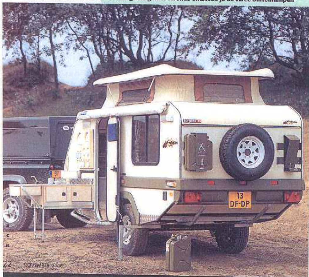
Even de keuken naar buiten om midden in de natuur een potje te koken. Boven de keuken kan het 'servies' aan de wand worden gehangen. 's Avonds ontsteek je de twee buitenlampen

en opbouw worden onder de meest extreme omstandigheden bij elkaar gehouden door het zeer stijve chassis, dat uit zware gegalvaniseerde stalen kokerprofielen is samengesteld. Omdat de wielen van een terreinauto op onverharde bodem nogal eens een steen wegslingeren, is de Xplorer voorzien van zware, geprofileerde aluminium beplating aan de voorzijde van de caravan.